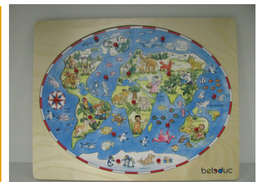
#557 Casse-tête du monde