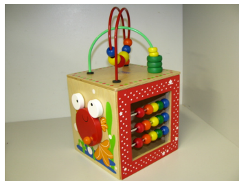
#253 Boîte de découverte