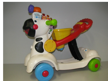
#1014 Trotteur zèbre 3-1